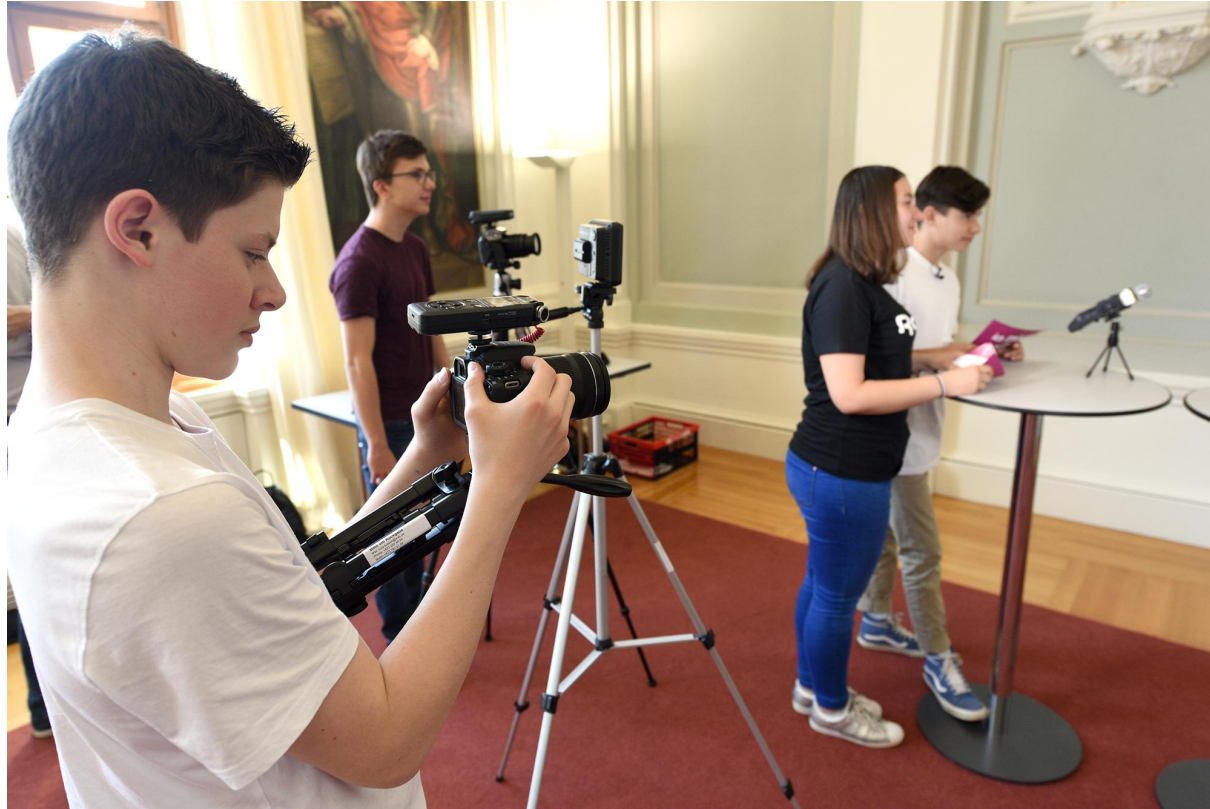
Projekt Backstage: 2018 Gewinner