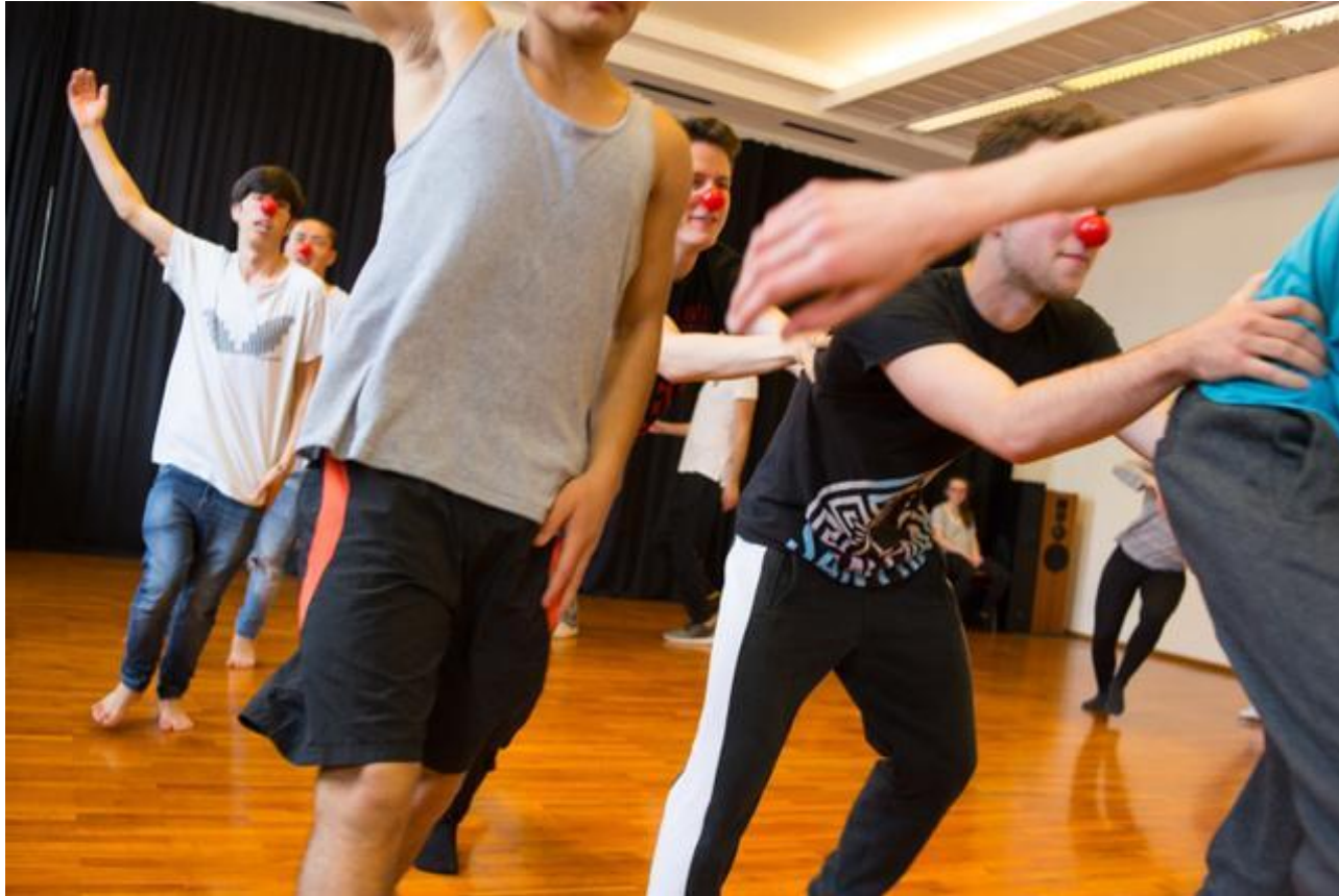
Jugendtanzprojekt Sketches (walktanztheater)